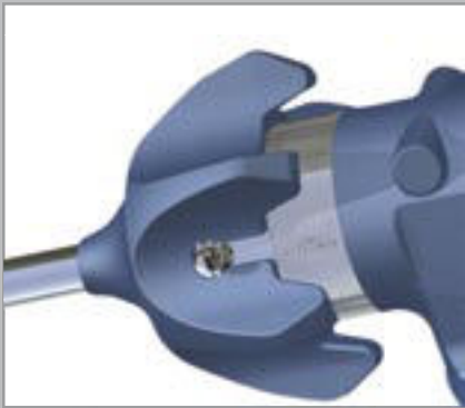
Schaft Nr. 126-002-800