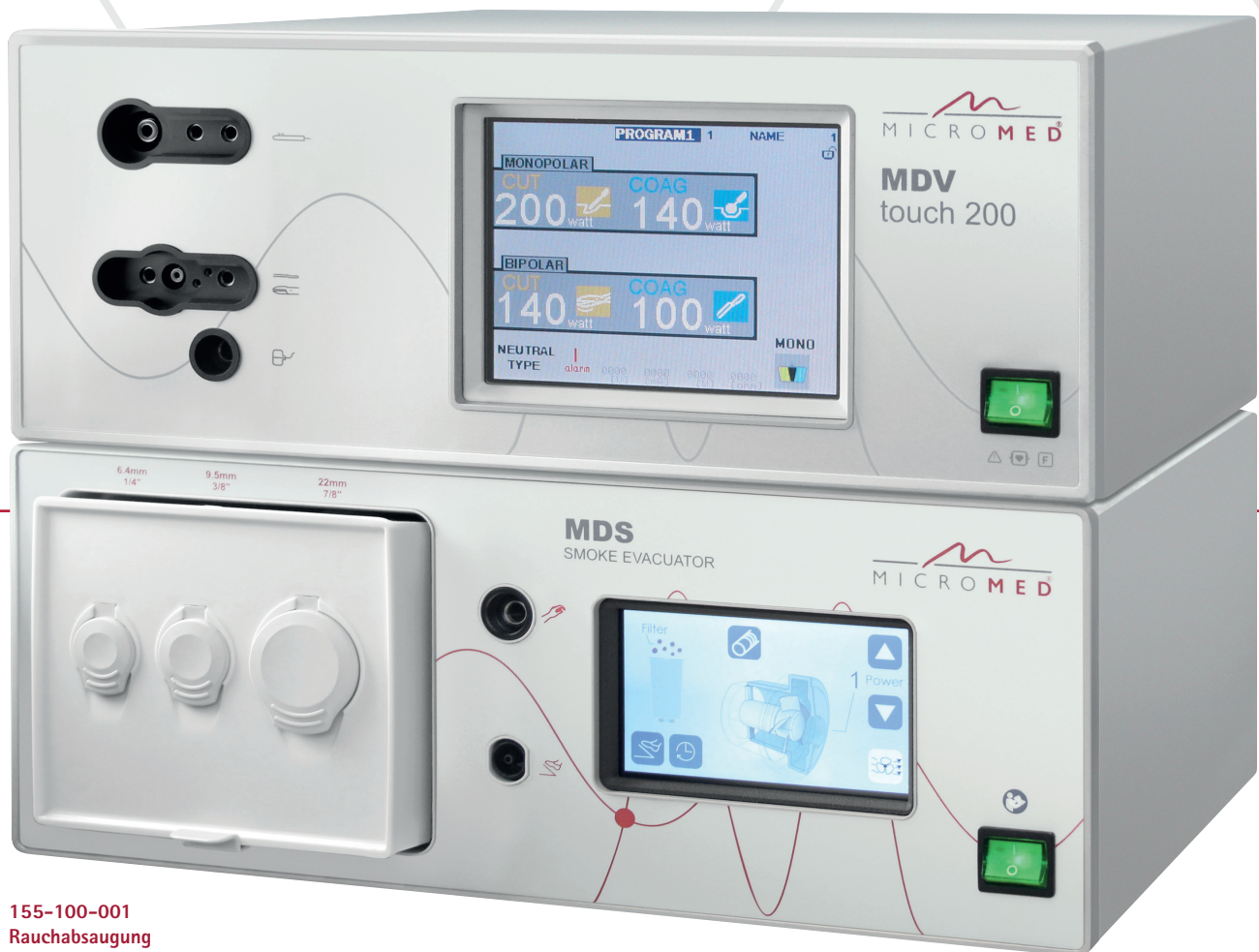
155-100-001 Rauchabsaugung MDS SMOKE EVACUATOR Smoke evacuation MDS SMOKE EVACUATOR

Der MDS SMOKE EVACUATOR kann mit einem HF-Gerät wie zum Beispiel MDV touch 200 verbunden werden. Die HF Geräte können bequem übereinander gestellt und durch die Verankerungen leicht positioniert werden.